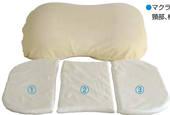
高さ調節3分割パッド